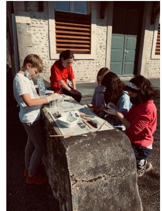
Le CME en plein travail

Les petits conseillers actuels du CME et le Conseil Municipal ont souhaité remercier l'équipe des petits conseillers du mandat précédent, en les conviant à une réception et leur remettre un petit cadeau.