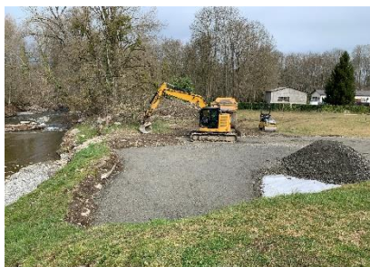
Les travaux du Pont de Secours

Après le sinistre survenu le 10 janvier dernier, une solution devait être trouvée rapidement. L'utilisation de la véloroute a été d'un grand secours, cependant cela ne peut être une solution pérenne.