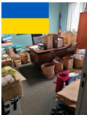
Une partie des dons récoltés pour l'Ukraine

En solidarité avec l'Ukraine, à la demande également d'habitants d'Igon et de l'AMF et en partenariat avec la Protection Civile, la municipalité a organisé une collecte de dons à la Mairie les lundi 7 mars et mardi 8 mars. Les Igonaises et Igonais se sont mobilisés puisque c'est l'équivalent de deux palettes de cartons contenant des produits d'hygiène et de première nécessité qui ont été remis à la Protection Civile en charge de la logistique du regroupement des collectes et de l'acheminement en Ukraine.