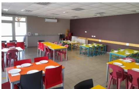
Une vue de la cantine de l'école

Les inscriptions pour la rentrée scolaire 2022/2023 ont débuté. Elles se font d'abord en Mairie qui transmet ensuite les dossiers à l'école. Pour inscrire votre enfant : Adressez-vous directement au secrétariat de la Mairie. Téléchargez le dossier d'inscription sur le site de l'école http://ecolepubliqueigon.fr dans documents à télécharger et déposez-le à la mairie qui vous communiquera les démarches pour accéder aux services périscolaires. Pour information l'école est composée de 3 classes équipées en Vidéo Projecteurs Interactifs et elles sont pourvues de matériel informatique.