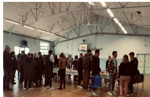
L'apéritif du dimanche

A l'avenir, un rôle plus citoyen, au service de l'intérêt commun pourrait être confié aux conscrits. A l'exemple de cette année, nos jeunes conscrits ont nettoyé les berges de l'Ouzom, ils ont également organisé des jeux pour les enfants le samedi après-midi. Ces actions seront sûrement à renouveler et à développer dans les années futures.