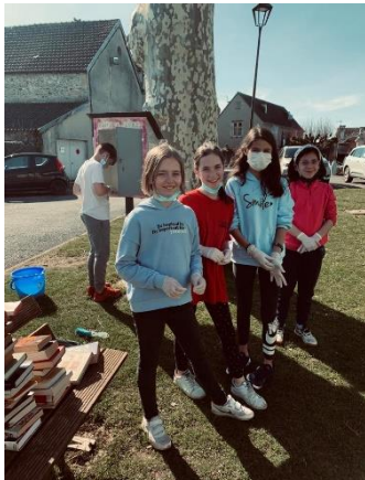
Opération peinture des enfants du CME sur les boîtes à lire

Les jeunes du conseil municipal des enfants ont nettoyé et repeint les deux boîtes à lire pendant les dernières vacances scolaires.