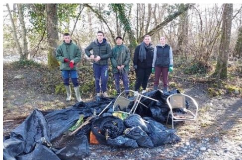
Nettoyage des berges de l'Ouzom par les conscrits

Depuis 2 ans la fête des conscrits n'avait pas lieu en raison de la crise sanitaire.