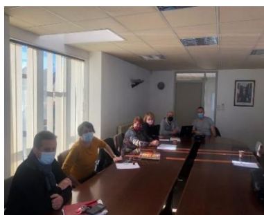
Réunion de travail avec l'APGL

Comme annoncé sur notre dernière communication, le créateur d'origine de notre site internet n'étant plus en activité, il nous est difficile de le mettre à jour.