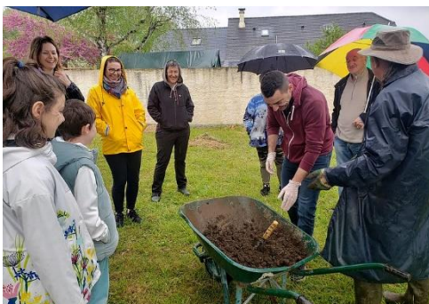
Un atelier de "Tout se sème"

L'association « Tout se sème » continue ses aménagements sur le terrain situé en bas de la cote de la Monjoie.