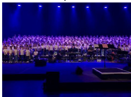
Jazz in school au Zénith

Le 24 juin avait lieu la fête de l'école Arc en Ciel, le lendemain se déroulait celle du Beau Rameau . De beaux spectacles et des ambiances conviviales grâce également à l'implication des associations de parents d'élèves et des professeurs.