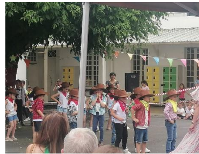
La fête au Beau Rameau