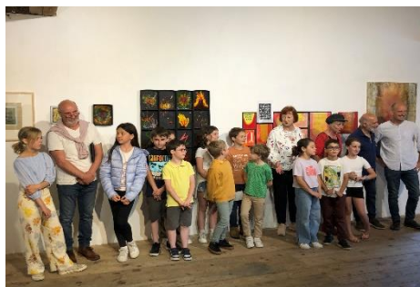
L'exposition à Nayart